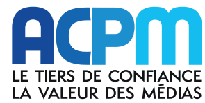
Logo ACPM en 2021