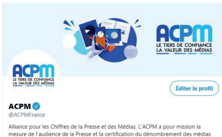
Une nouvelle communication sur les réseaux sociaux