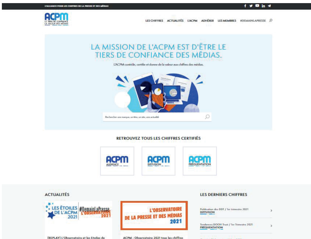
Nouveau site acpm.fr

Les communiqués de presse disposeront d'un logo propre à chacune des activités : Audience, Diffusion, Fréquentation. Enfin lorsque l'ACPM prendra la parole au nom de l'association, un logo unique sera utilisé.