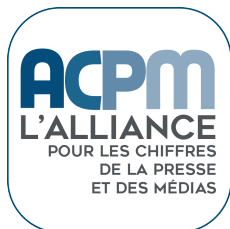
Logo ACPM en 2015

La nouvelle signature de l'ACPM «L'ACPM : Le tiers de confiance, la valeur des Médias» affirme les valeurs de transparence, de rigueur et de confiance qu'incarnent l'ACPM.